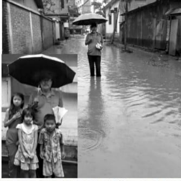
থ্যোদাংলোন লোমদা পুদ্ধমক পাধাশিনাখবনা অৱাবা ঈপান্তনি খসি ঐখোয়না তাওরিবা। ঐখোয় মীছ-না শিংবা তাই, ঐখোয় মশেল তথাবা তাই, মতেং পাংনবা তাই। মসিদী খদোংচাবা অসিদী

ঐবু লমজিবিগদবা মীশক অনুনা মাত থাহালগা ইডাগা নোংজু মরকা অনুম চংলে হাওজিং ফোর ওলগী তেরিফিকেসন। স্লাই মীয়ায়া হেলা বঙনরবনি স্লাই নাগামপাল শিংজুবুং লৈরক। লাইরিক